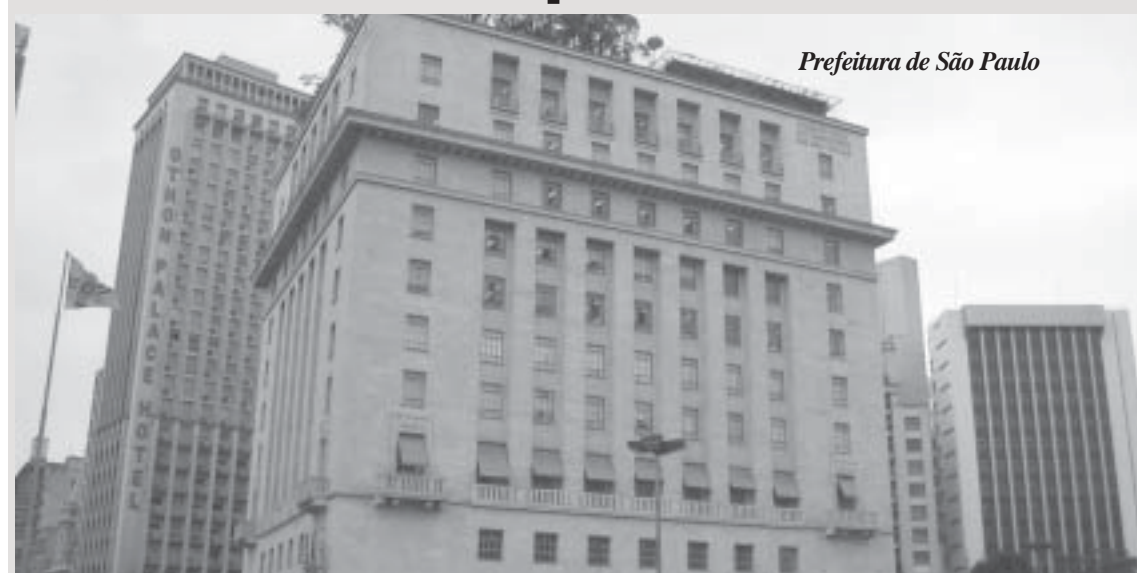
Prefeitura de São Paulo

Projeto de Lei Orçamentária Anual de 2015 prevê R$ 51,3 bilhões em receitas e R$ 7,8 bilhões em projetos. Gastos com Educação sobem 7%, Mobilidade Urbana 37% e Saúde 17%