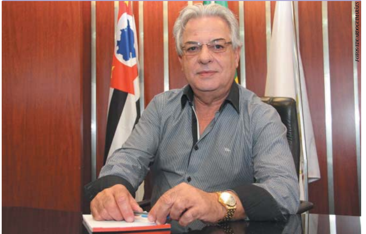
Prefeito de Poá Marcos Borges que assumiu a Prefeitura nesta semana